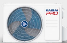
Външно тяло KRP