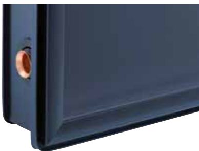
Колекторна рамка със специален профил за свързване с рамката за вграждане в покрив

ThermProtect при Vitosol 200-FM и Vitosol 100-FM повишава допълнително ефективността им в сравнение с други плоски колектори, тъй като няма състояния на стагнация на мощността и те могат отново да отдават топлина по всяко време.